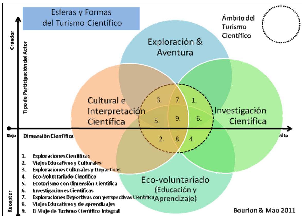
Figura n° 2.

En cada uno de estos segmentos podemos así visualizar un sinnúmero de posibilidades de productos. Destacamos para Aysén algunos de estos casos, análisis del capítulo 1, y resumido en la tabla n° 1. Esta aparente complejidad puede a la vez ser apropiada por los operadores para que sean innovadores en la construcción de nuevos productos. La idea de “territorio turístico creativo” puede aquí encontrar todo su significado. En un espacio turístico “periférico” como Aysén, productos clásicos muestran sus límites lo que obliga a los operadores a una mayor creatividad en su oferta. Si bien el concepto no es nuevo al nivel mundial, en Aysén se está implementando como una estrategia de desarrollo territorial. No se trata solo de una iniciativa de un grupo de actores pero una voluntad política fuerte de basar las dinámicas turísticas en su conjunto en esta perspectiva (cf. www.turismocientifico.cl ).